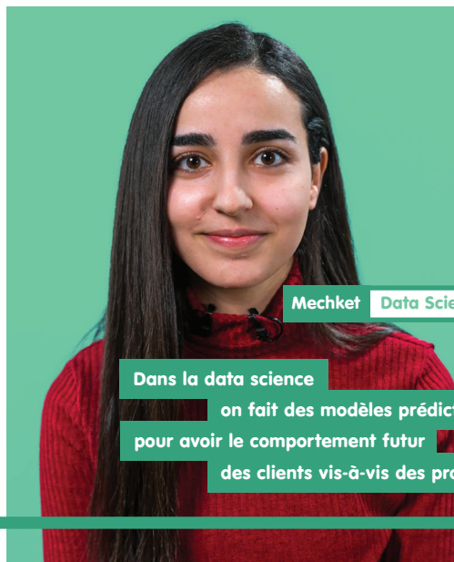
Meckhet Data Scientist

Dans la data science on fait des modèles prédictifs pour avoir le comportement futur des clients vis-à-vis des produits.